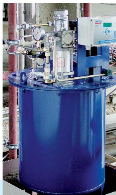
Комплектная насосная станция с системой управления